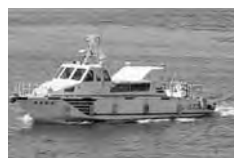
港湾業務艇「あきかぜ」