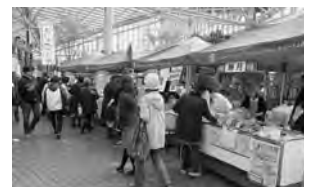
マルシエdeポート土崎

*秋田市以外(男鹿市、潟上 市、三種町、大瀧村)のイ ベントなどはホームページ でもご覧いただけます。