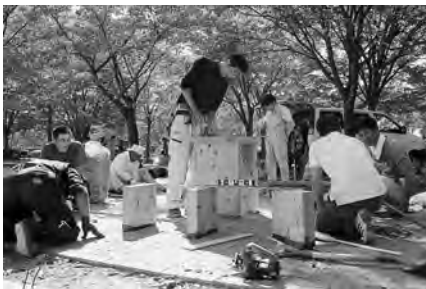
秋田建築労働組合青年部の10人が参加