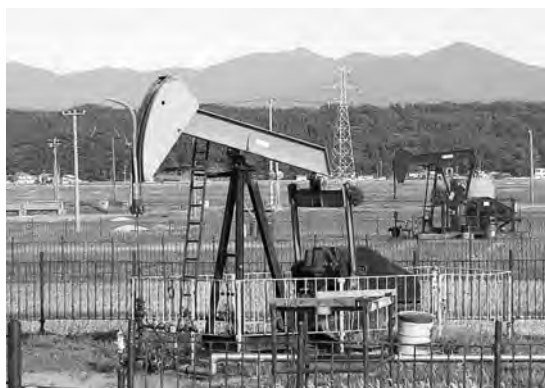
今も稼働するポンプ式油井(外旭川地区)

それはさておき、このバツタの アタマのような形をした油井の 姿。のんびりと馬が草を食んでい