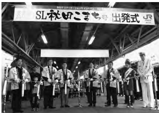
SL秋田こまち号出発式で、右から4人目が市長 (10月12日、JR秋田駅)