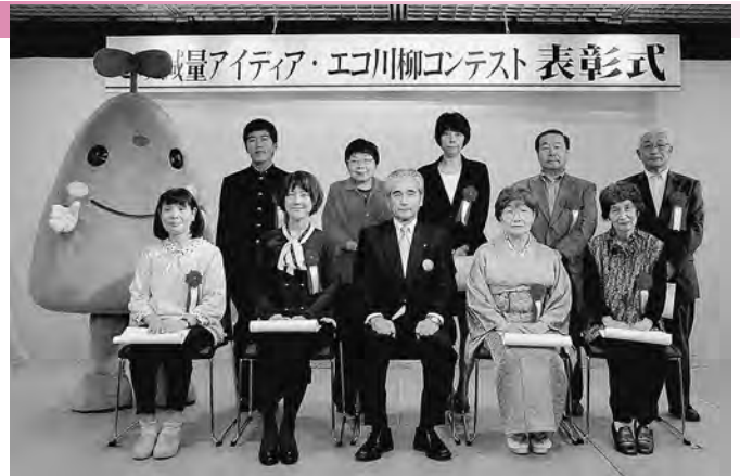
にぎわい交流館で行った表彰式(10月6日)