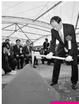
穂積市長による鍬入れの儀