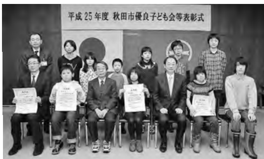
平成25年度 秋田市優良子ども会等表彰式