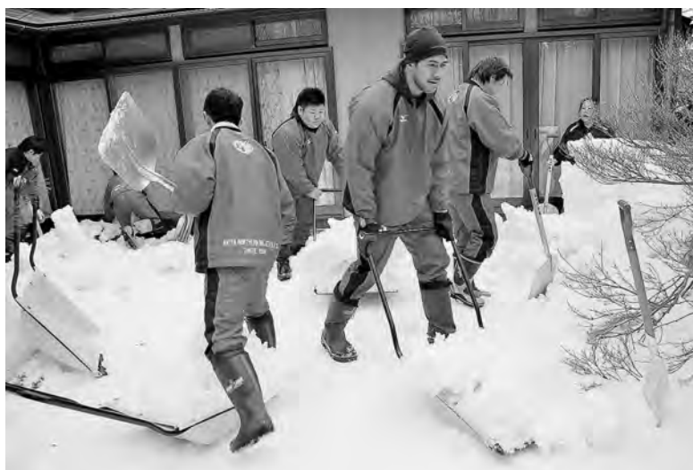
雪をかきだし、ダンプで捨てる。作業の手際は息ぴったり！