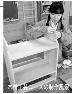
木材工芸コースの制作風景

郷土秋田の工芸界を担う生徒(1・2年生)の作品をご鑑賞ください。観覧料200円(中学生以下無料)。