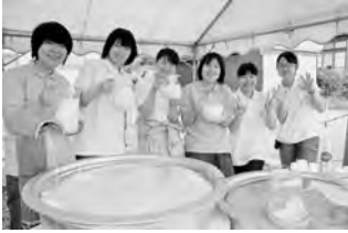
公立美術大の学生も参加！