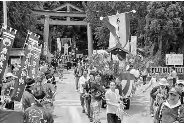
各町内の鹿嶋船が順番に新屋日吉神社に集まりました

地域の伝統行事「新屋鹿嶋祭」。今年も、手製の船に鹿嶋人形を乗せ、子どもたちが綱を引き、町内を練り歩きました。