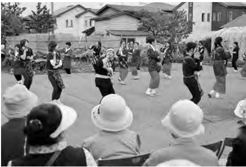
仁井田中央会館広場で手踊りなどを披露

仁井田地区では、梅雨の晴れ間に「第18回あきた大落まつり」が開催されました。民謡の手踊りや仁井田小児童による落刈りのほか、落せんべいや落アイスの試食なども行われ、地元特産物の大落を囲んで地域のみなさんがふれあいました。