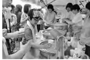
おいし〜、冷たい湧き水