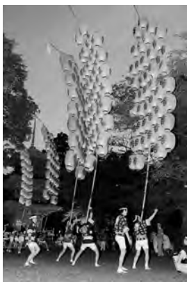
本番さながらの演技

8月の祭り本番まであと少 しですが、差し手、囃子方と も、その準備は万全の様子。 七夕さまに願いを込めて、今 年も「晴れ舞台」で最高の演技 ができますように!