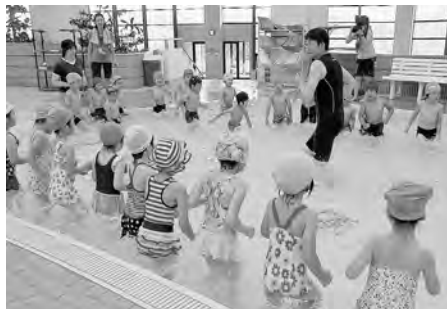
水泳の先生がやさしく教えてくれたよ