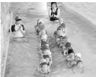
みんなでプ～カプカ