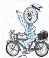
ナイスライダーくん

秋田市中心市街地活性化協議会では、自転車利用者を応援するサポート・ショーピングや、駐輪場地図などの情報を掲載した「ナイスライダーパスポート」を9月30日(火)まで配布しています。