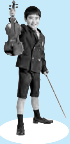
オーケストラの舞