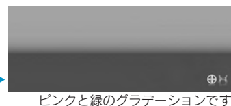
ピンクと緑のグラデーションです