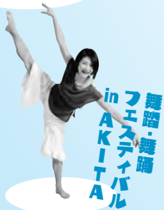
舞踊・舞踊 フェスティバル in AKITA