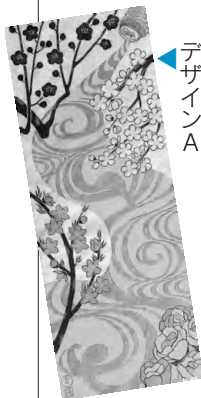
デザインA デザインB