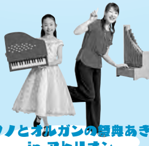
ピアノとオルガンの舞あきた in アトリオン