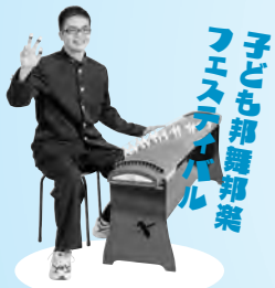
子ども邦舞邦楽 フェスティバル

待ちに待った「国民文化祭・あきた2014」 さあ、みんなでイベント会場にレッツ・ゴー!