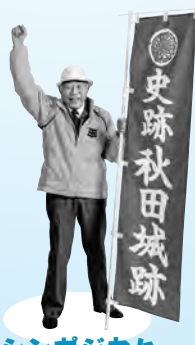
シンポジウム 「古代秋田に集った人々」