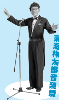
東海林太郎音楽祭