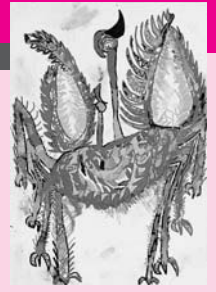
作品「負ケテタマルカ!!」