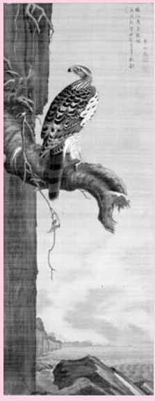
「鷹図」(小田野直武) 江戸時代後期