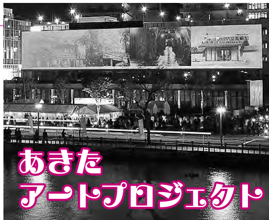
昨年の秋田幻燈夜の様子