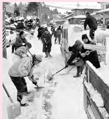
前回の一斉除雪デー

市では、1月12日(月・祝)に、地域住民の協力で町内や学校周辺の通学路などの除排雪を行う「市民一斉除雪デー」を予定しています。ご協力をお願いします。