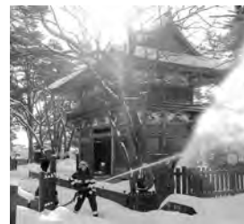
天徳寺での昨年の 防火訓練の様子