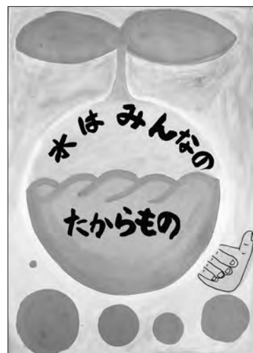
平成26年度最優秀作品