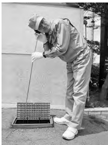
音聴棒という機器で、振動音を聴きながら漏水を調査します

対象地区 ◆金足、下新城、上新城、飯島、土崎、將軍野、外旭川、新藤田、旭川、添川、濁川、手形、泉、寺内、八橋、中通、千秋、川元、川尻、山王、楢山、南通、牛島、大住、仁井田、新屋、浜田、豊岩、下浜、雄和楢川、(以下河辺地域)北野田高屋、諸井、和田、赤平、岩見、三内、大沢、神