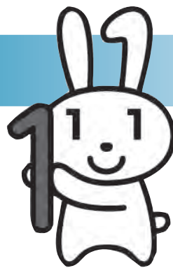
マイナンバー制度 イメージキャラクター 「マイナちゃん」

平成28年1月から、全国で始まる「マイナンバー制度」。その概要を知ってもらうため、ワンポイント解説をシリーズでお知らせします。秋田市番号制度導入推進室☎(066)6653