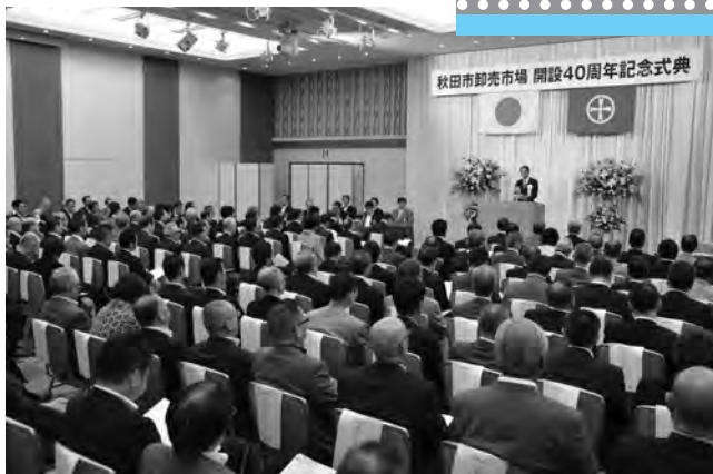
たくさんの市場関係者が節目の年を祝いました