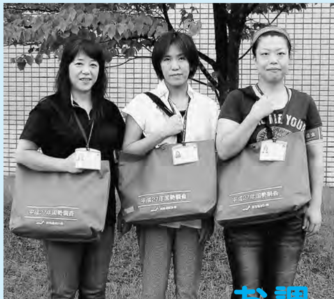
国勢調査員のみなさん