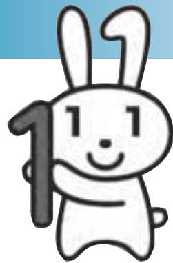
マイナンバー制度 イメージキャラクター 「マイナちゃん」

平成28年1月から、全国で始まる「マイナンバー制度(社会保障・税番号制度)」。その概要を知ってもらうため、ワンポイント解説をシリーズでお知らせします。秋田市番号制度導入推進室 ☎(866)6653