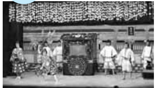
舞台装飾も華やか。思わず物語に引き込まれます