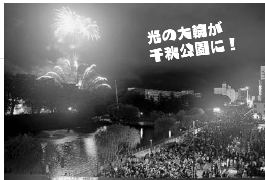
光の大輪が千秋公園に！