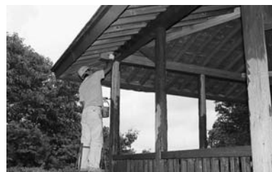
会員9人が手際よく作業しました

9月27日、秋田建築労働組合青年部のみなさんが地域貢献の一環として、一つ森公園のあずまやの補修などを行いました。同青年部では、平成14年から毎年このような公共施設の補修ボランティアを行っています。今年もありがとうございました。