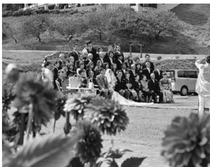
お二人の門出をダリアも祝福

見頃を迎えた彩り豊かなダリアに囲まれた中でのセレモニーは、自然の演出でまさに華やかな雰囲気。周りから祝福され、はにかむ新郎・新婦の笑顔に、幸せをちよつとおすそわけしてもらった気分になりました♪