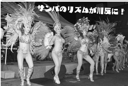
サンバのリズムが川反に！