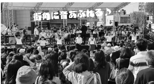
街角に音あふれる♪