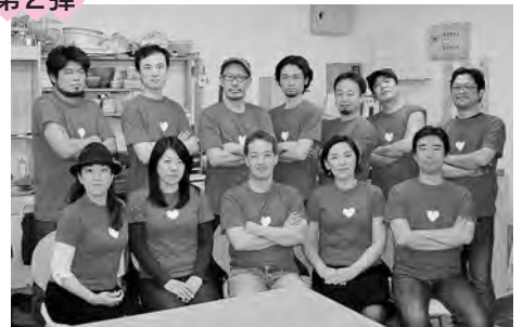
みなさん1970年前後の生まれです