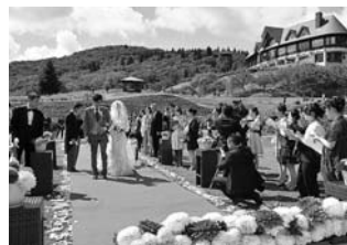
ダリアの装飾が華やか