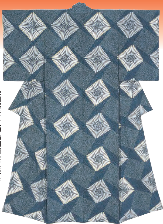
森口邦彦「友禅訪問着」(方花文) 2001年文化庁蔵【前期】