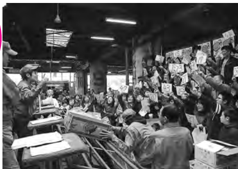
市民参加のせりの様子