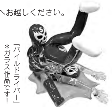
「パイルドライバー」*ガラス作品です！