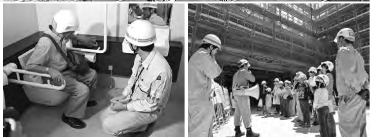
バリアフリー説明会(8月26日)