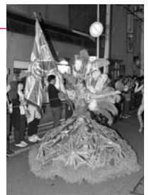
川反サンパルカーニバル