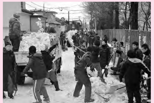
前回の一斉除雪デー(八橋地区)