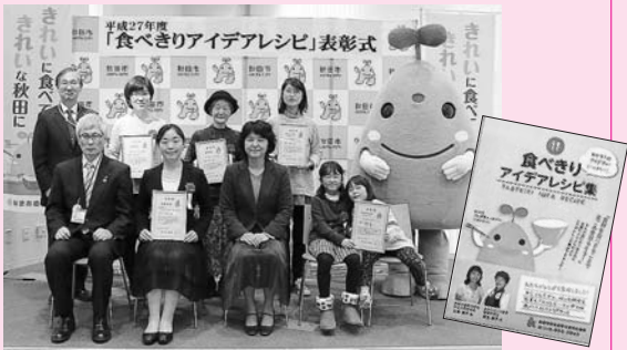
賞状を持っているのが入賞者のみなさん