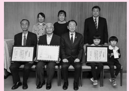
11月16日、市役所で行った表彰式で

アサガオなど、つる性の植物で作る「緑のカーテン」がある風景を撮影した写真コンテストに、今年は15点の応募がありました。寄せられた作品を、にぎわい交流館に展示し、来館者による投票を行った結果、上記のみなさんの作品が入賞しました。おめでとうございます。環境総務課☎(863)6862