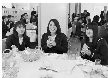
参加した生徒たちも試食に満足

金足農業・秋田商業・秋田工業の生徒が、地元産農産物などを使った商品開発を行う「17歳の6次産業化プロジェクト」の商品アイデア発表会を、2月3日に開催しました。