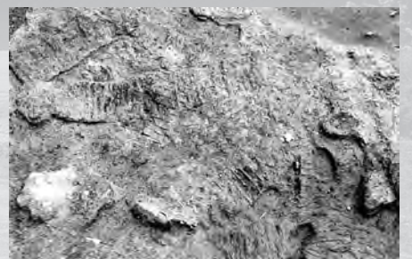
発掘された甲の様子