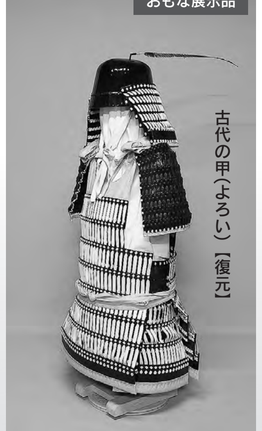
古代の甲(よろい)【復元】

木簡は、当時紙が貴重だったため、紙の代わりに荷札などとして用いられました。写真の木簡は、「天平六年月」とクギ書きされたもので、「続日本紀」にある「天平5年条の出羽柵秋田村高清水岡への遷地(場所を移すこと)」の記事を裏付ける重要な資料です。