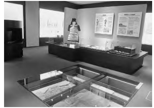
資料館内の展示室