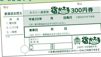
「宿かえるチケット」見本

※(注1) 秋田市内のすべての 法人タクシーが対象です。 (個人タクシーはのぞきます)