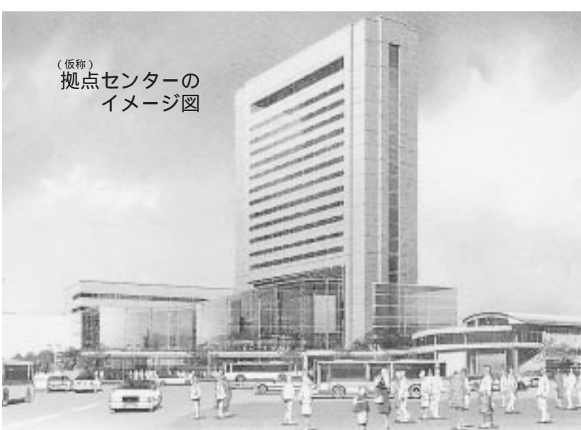
(仮称)拠点センターのイメージ図

下水道普及率は、来年三月末で六五・〇割、今年三月末現在六二・五割に達する見込みです。