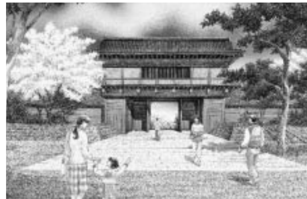
千秋公園表門の完成予想図

千秋公園では、史実に基づく表門復元の実施設計と、自然を保全し植物や野鳥に親しむ自然ゾーンの実施設計を行います。太平山リゾート公園では、新オートキャンプ場八区画と花公