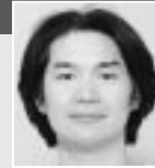
倉田よしみ (味いちもんめ)