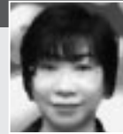
いがらしゆみこ (キャンディー・キャンディー)