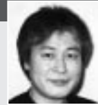
三浦みつる (Theかぼちゃワイン)