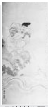
平野喜伴 恵比須図