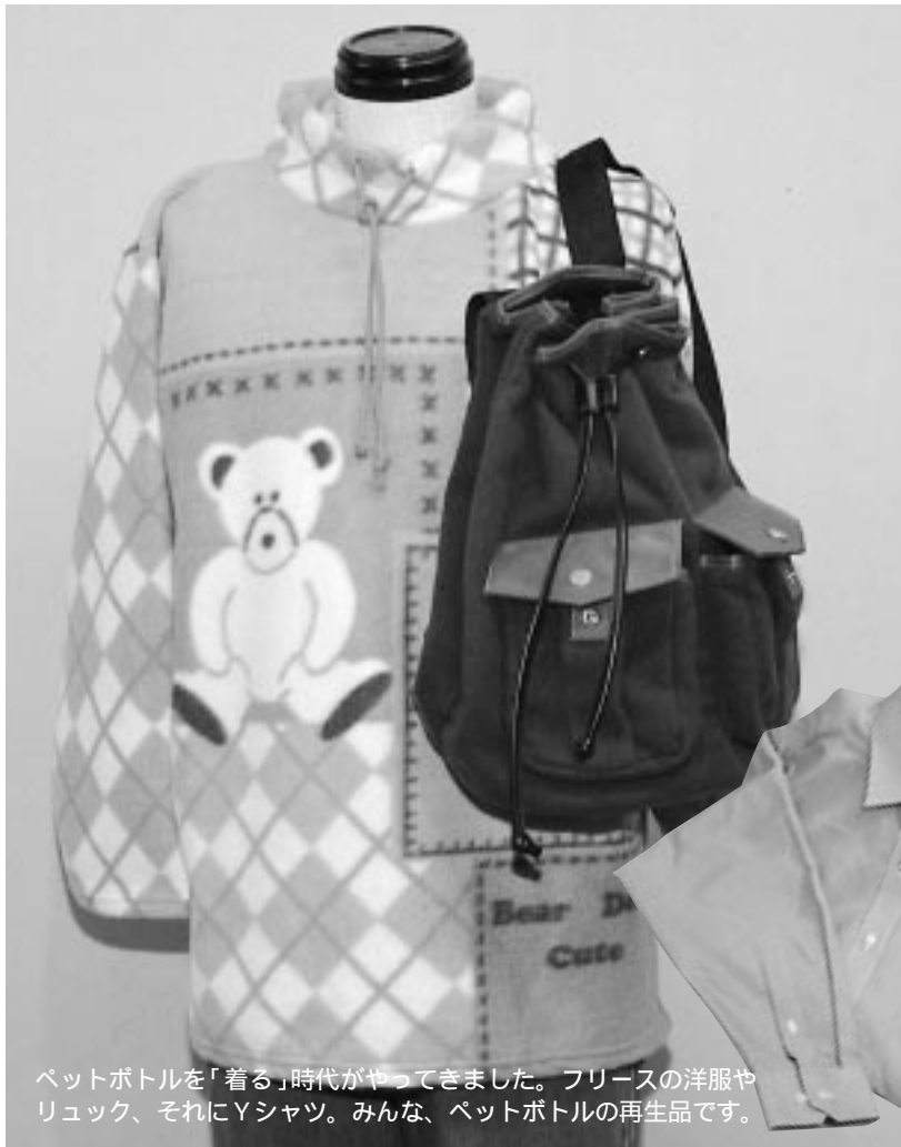
ペットボトルを「着る」時代がやってきました。フリースの洋服やリュック、それにYシャツ。みんな、ペットボトルの再生品です。

平成11年 編集発行 秋田市役所広報課 〒010-8560 秋田市山王一丁目1-1 ☎(863)2222 秋田市ホームページ http://www.city.akita.akita.jp/