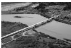
秋田南大橋も完成

市債 市債とは市の借入金のことで、小・中学校のように将来まで役立つ施設の建設費などを、後世代の人々にも応分に負担してもらうため設けられているものです。平成10年3月末現在の額は下表のとおりです。