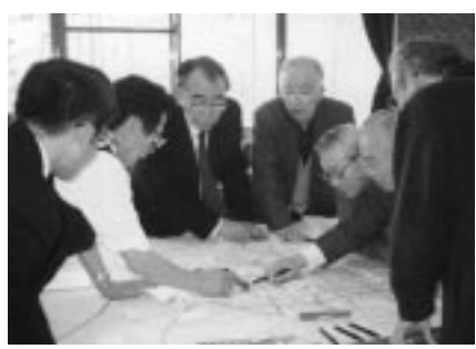
東部地域まちづくり懇談会

懇談会で出された主な意見 ・東部地域には大学が立地しており、文教地区としてのまちづくり、若者が賑わうようなまちづくりをしたい。 ・駅東西を連絡する道路・交通体系を強化し、JR線路を越えた地域のつながりを強めたい。 ・人口6万6千人に対し、東部公民館ひとつでは少ない。東部複合文化センターの建設を！