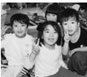
勝平保育園のお友だち