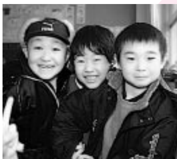
ぼくたちもまってるよ!

やさしいせんせいや、やさしいおにいさん、おねえさんがみんなをまってるよ。ともだちもたくさんできるよ。ニッコニコのいいえがおで、にゅうがくしきにきてね!