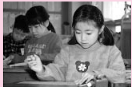
お勉強もいっしょうけんめい