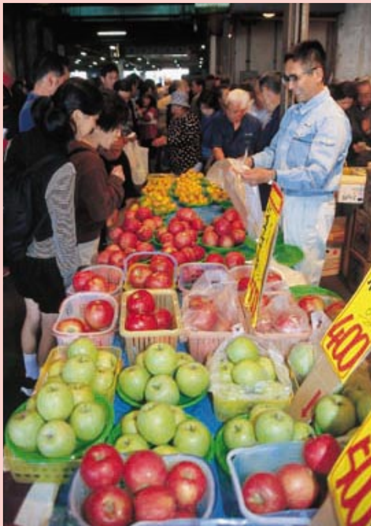
おいしそうな色艶のりんごが店先に並びます