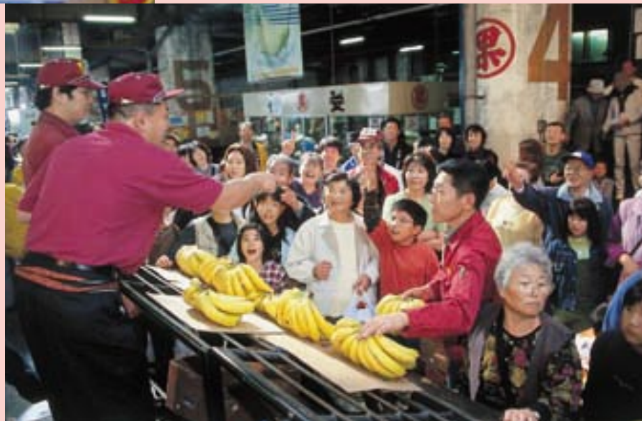
市民参加のせり。 こんな大きなバナナ を200円で競り落と しました

10月14日、中央卸売市場まつり。 新鮮な魚や野菜、果物を安い値段で食べてもらおうと、 収穫の秋にあわせて毎年開いています。 サンマや毛ガニ、すじこなどの海のごちそう...。 マイタケ、セリ、キリタンポ、お鍋の材料もそろいます。 大きなマグロの解体売りといった粋な演出も 活気ある市場ならでは...。 市民参加のせりでは、人が幾十にも重なって、 我先にとお目当ての食材を競り落としていました。 ハタハタ1.2キロ1,500円！和歌山産柿1箱1,200円！ 思わず食欲もそそられます。 秋の味覚、太るのなんて気にしてられません。