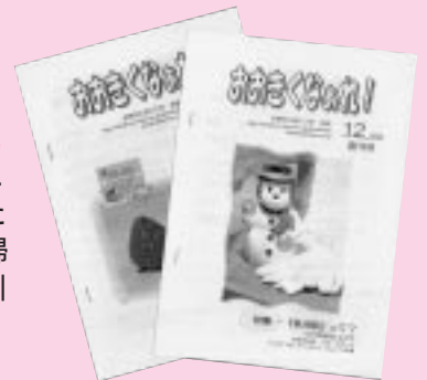
会報「おおきなあれ!」

子どもたちと遊んでくれるかた 医療関係者(小児科医や看護婦 さんなど)で、講演や相談を引 き受けてくださるかた