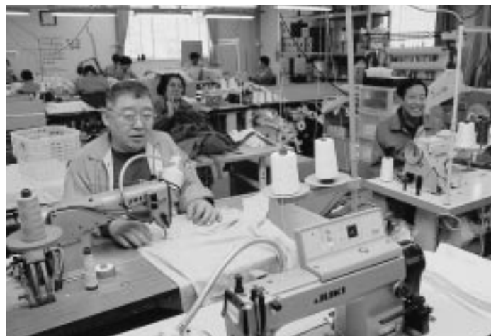
身体障害者の授産施設「秋田ワークセンター」で

す。居宅サービスを行う市内の指定事業者は、左の一覧表をご覧ください。なお、日常生活用具の給付など、支援費制度の対象とならないサービスは、これまでと同様に利用することができます。