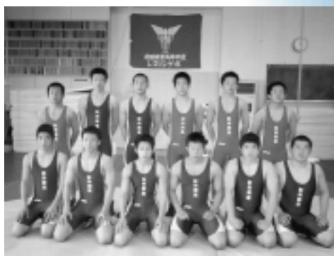
秋田商業高校レスリング部

秋田市スポーツ賞は、各種スポーツ大会で優秀な成績を収めたかたなどに、市体育協会から贈られます。次のかたは、十五年度の第一次受賞者のみなさんです。☎(866)2247