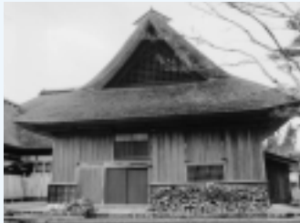
三浦家住宅 (金足黒川字黒川)

京仏師・長嶋外記が宝永元年(一七〇四)に制作し、湯沢佐竹南家第七代義安が泉福院に寄進したものです。優れた仏像彫刻として貴重であり、近世京仏師の活動や仏像彫刻史の展開を知るうえで重要な作品です。