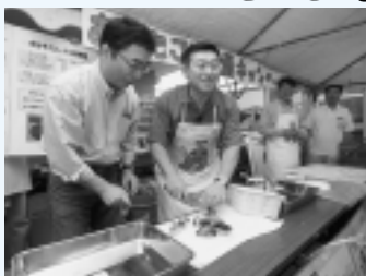
昨年のごみ減量キャンペーン。 佐竹市長もチャレンジ