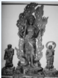
長嶋外記作 (泉三嶽根 泉福院)

京仏師・長嶋外記が宝永元年(一七〇四)に制作し、湯沢佐竹南家第七代義安が泉福院に寄進したものです。優れた仏像彫刻として貴重であり、近世京仏師の活動や仏像彫刻史の展開を知るうえで重要な作品です。