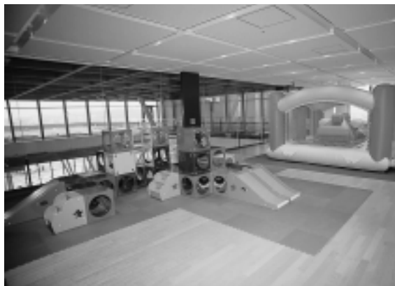
ふれいーむ お友だちと大型遊具で自由に遊べます