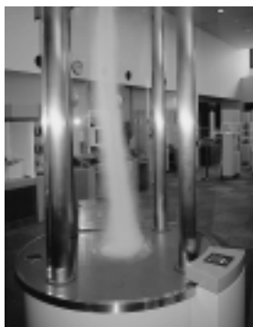
踊る竜巻 スイッチを押すと竜巻が発生。形を変化させることができます。