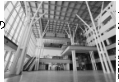
アルヴェきらめき広場