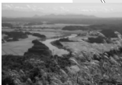
高尾山からの眺め

小高い丘を彩るダリアが見ごろの「秋田国際ダリア園」、山菜料理などが楽しめる「里の家」、自家製アイスなどが味わえる「味工房」など、景色もおなかも大満足のエリアです。