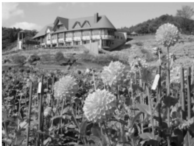
秋田国際ダリア園。写真奥がヴィラ・フローラ