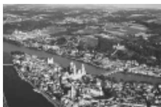
ドイツ・パッサウ市