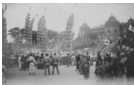
「福岡日々新聞主催 遊覧団体歓迎 記念 秋田名物竿燈」