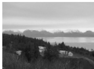
アメリカ・キナイ半島郡