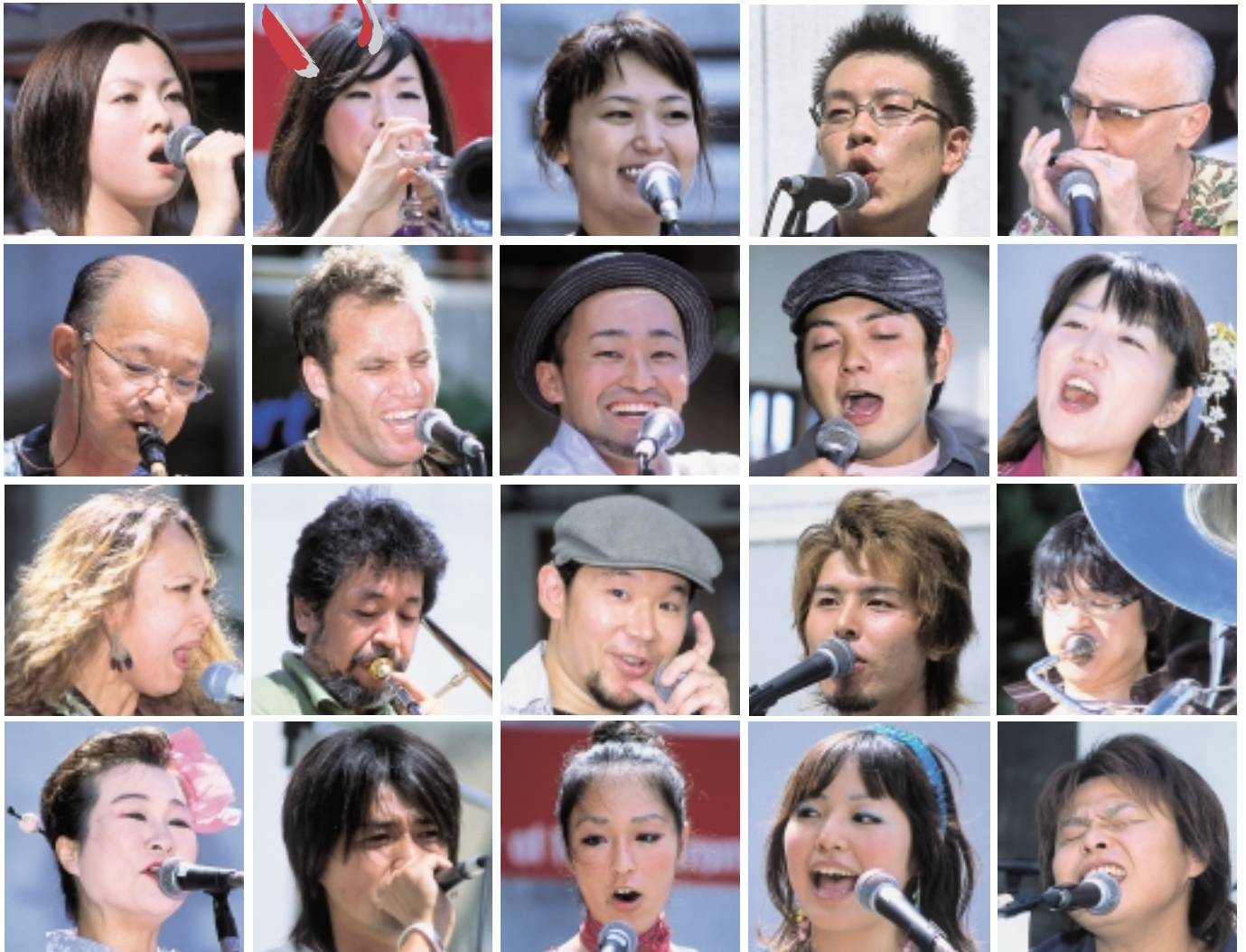
ザ・パワー・オブ・ミュージック(9月3日、大町で路上ライブ)