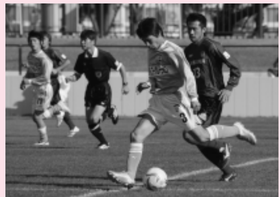
サッカーの秋田わか杉国体リハーサル大会(10月14日、八橋運動公園)