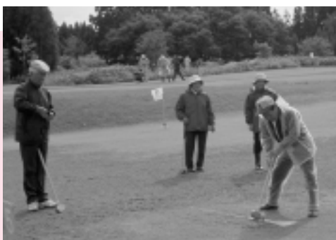
河辺小学区グラウンドゴルフ大会 (10月8日、スポパークかわべ)

もし、フグを食べてしびれがきたら、すぐに「フグを食べた」と言って119番へ電話しましょう。