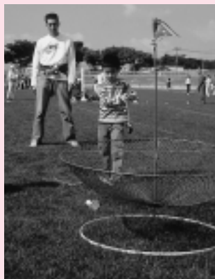
健康のつどい(10月9日、八橋陸上競技場ほか)