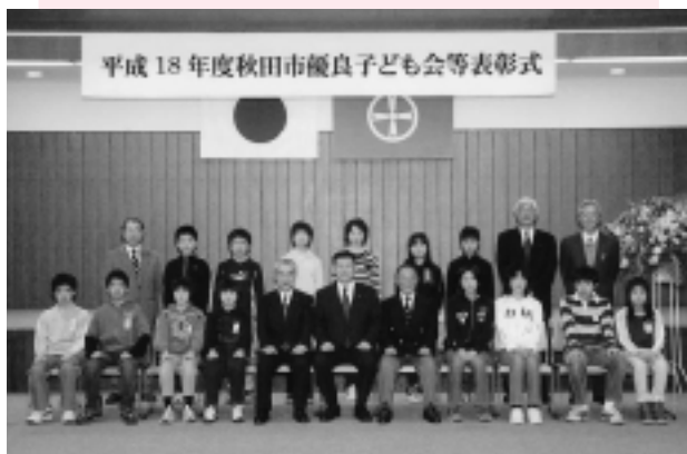
受賞者のみなさん