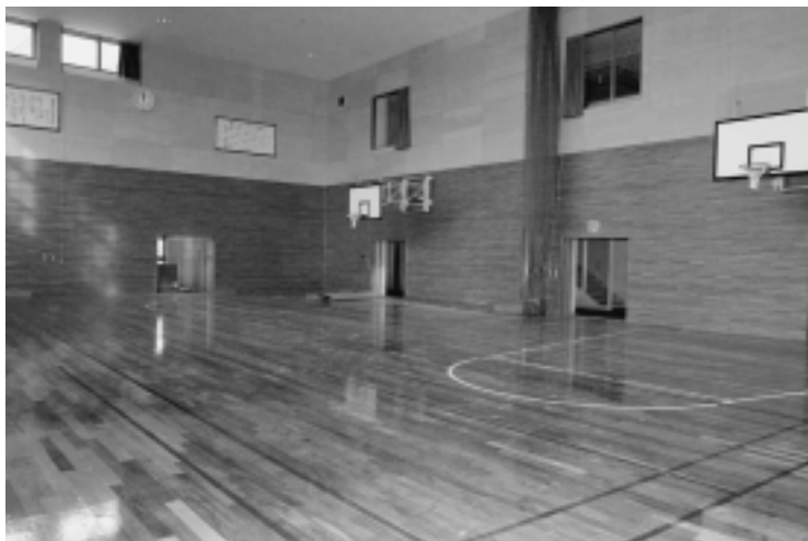
多目的ホール・遊戯室は、バスケットボール、バドミントンなど各種スポーツ活動に利用できます