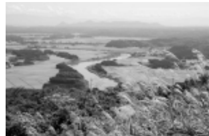
高尾山からの眺め

ボランティアガイドの案内で、高尾山を散策し、雄和地域出身の俳人・石井露月ゆかりの地をバスでまわります。参加無料。申し込みは、8月28日(火)まで。