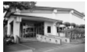
大森山老人と子どもの家