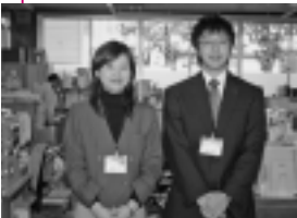
「資産税課は、市役所1階です」

なお、申告書が届かないかたは、資産税課償却資産担当へご連絡ください。 ☎(866)2836