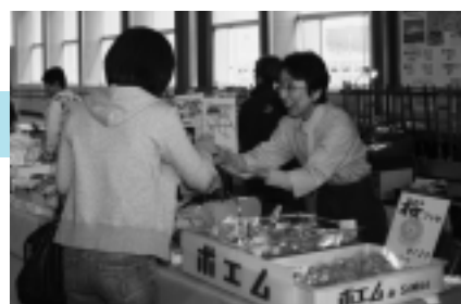
自慢の焼き菓子、食べてみて～

「秋田の駅前を元気にしたい」、そんな願いから昨年のわか杉国体の時期に始まった「秋田エキマエ元気市」。今年度最初の元気市は4月26日から5月6日まで、秋田駅ばぼろードで開催されました。お土産や漬物、山菜、オリジナルの限定スイーツなどが並び、なまはげも登場。たくさんのお客さんでにぎわいました。