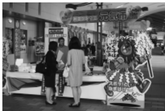
足を止めてくれたお客さんに秋田をアピール

地域の文化を肌で感じることができる秋田エキマエ元気市。秋田の「顔」として、全国から来てくれたお客さんを出迎えます。