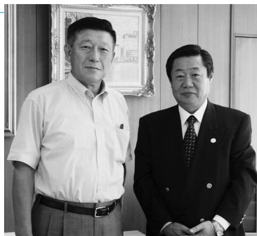
谷川・東京都副知事(右)と