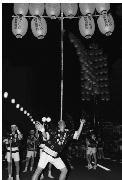
竿燈もオリンピック招致を応援！

東京オリンピックの特筆すべき点は、体操の小野喬・清子、遠藤幸雄など秋田県出身選手の活躍で、特に小野喬選手は選手団の主将を務め、