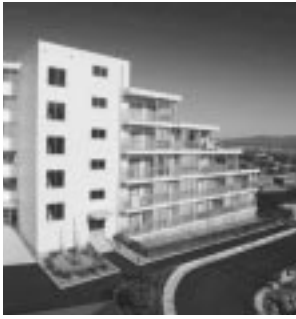
新屋比内町市営住宅