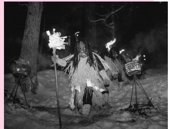
山の暗闇から現れるなまはげは迫力満点!

男鹿半島地区伝統の民俗行事「なまはげ」と神事「柴灯祭」を組み合わせた冬の観光行事です。神社境内にたきあげられた柴灯火のもとで繰り広げられる勇壮で迫力あるなまはげの乱舞は見る人を魅了します。